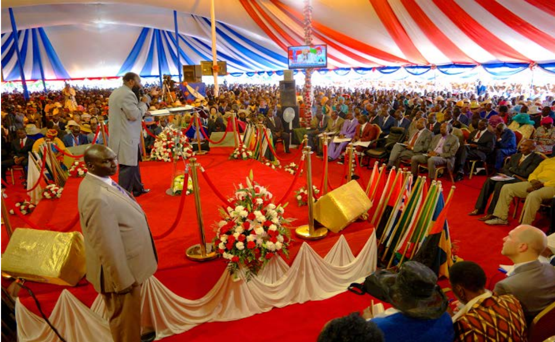
Pastorikonferenssi, Kisumu, Kenia 2.1.2016

Halleluja. Taakat nostetaan pois Golgatalla. Kiitos hyvin paljon.